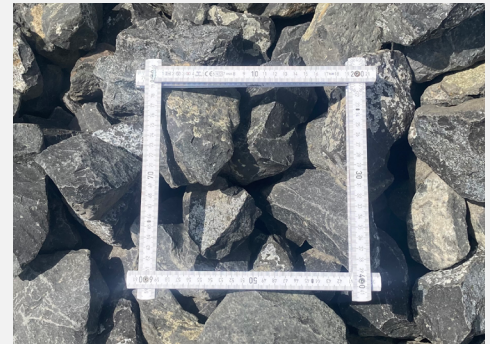
Basaltwerk Suhl - Nüsttal/Haselstein