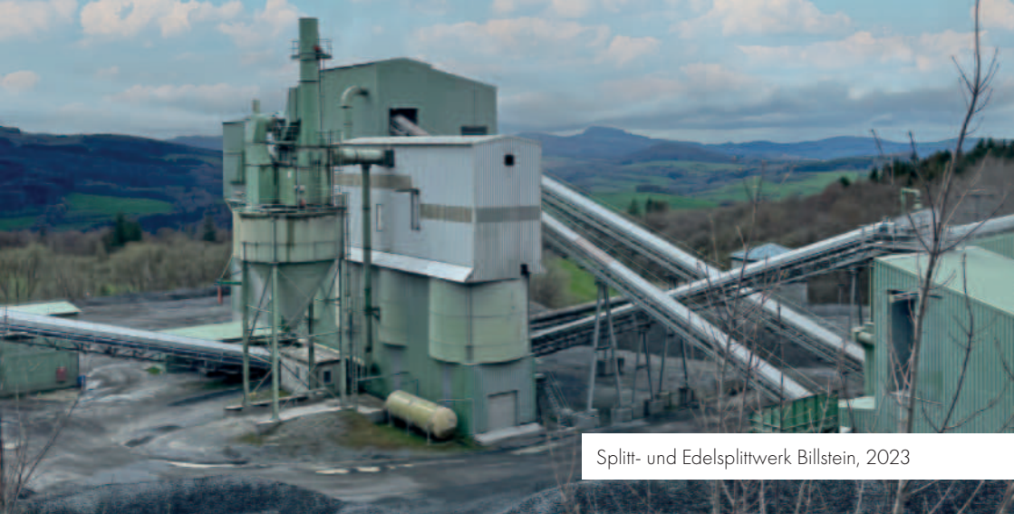
Splitt- und Edelsplittwerk Billstein, 2023