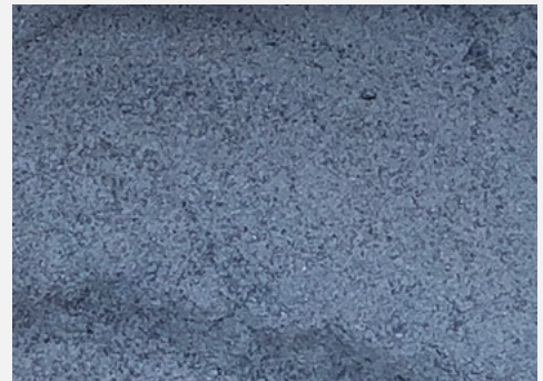
Basaltwerk Billstein, Basaltmehl 1000 „Rohzustand“